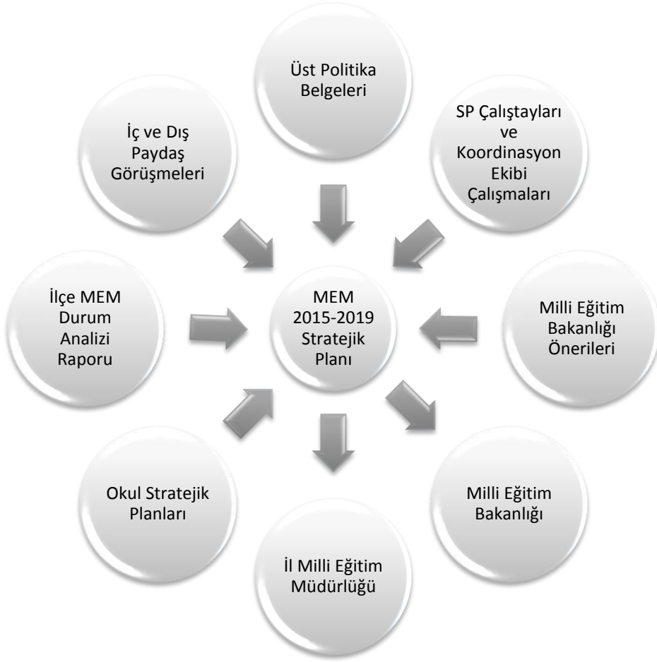
Şekil 2: Plan Oluşum Şeması